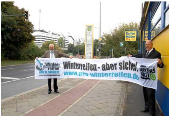
Kraftfahrzeuge mit Winterreifen auszurüsten.